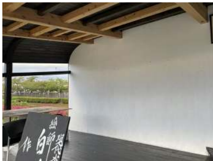
(テラスギャラリー、ホワイトウォール)