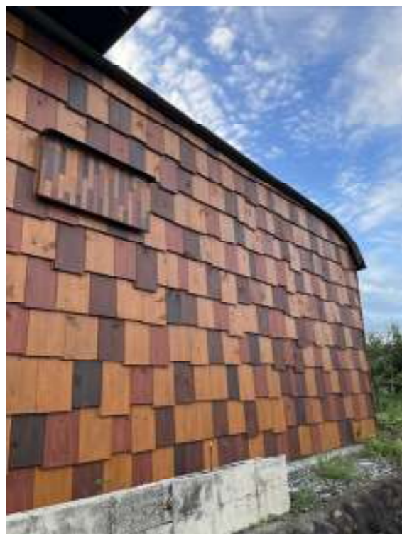
(糸貫川堤防より西の板壁)