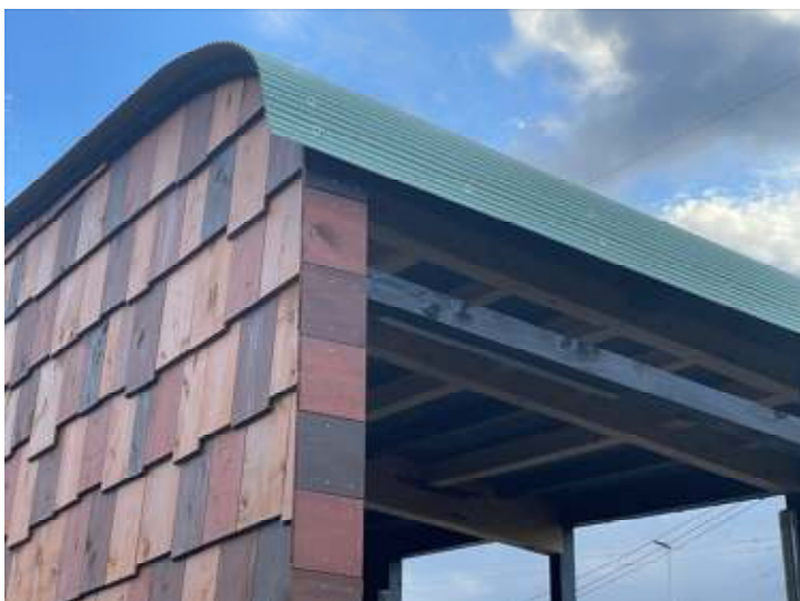
(アール屋根と板壁)