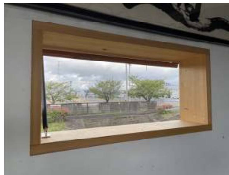
(小窓内観 糸貫川を見る)