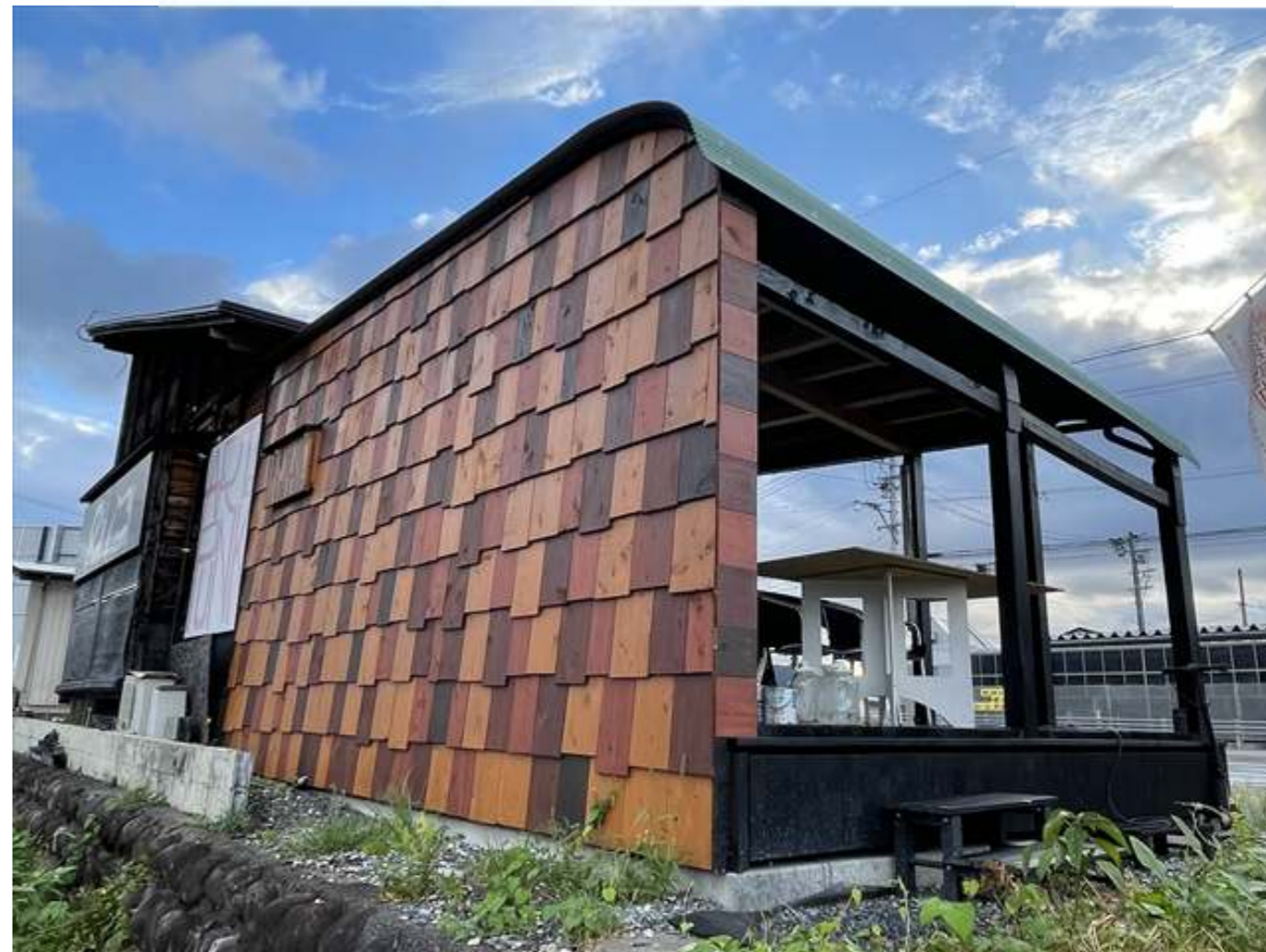
(糸貫川堤防よりテラス外観)